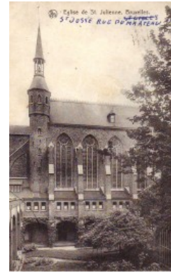
Julianakapel en vml. klooster van de apostolinen van het Heilige Sacrament, afgestempeld op 1911.