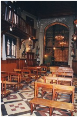
Liefdadigheidsstraat 41-45, Julianakapel en vml. klooster van de apostolinen van het Heilige Sacrament, Oratorium (foto 1993-1995).