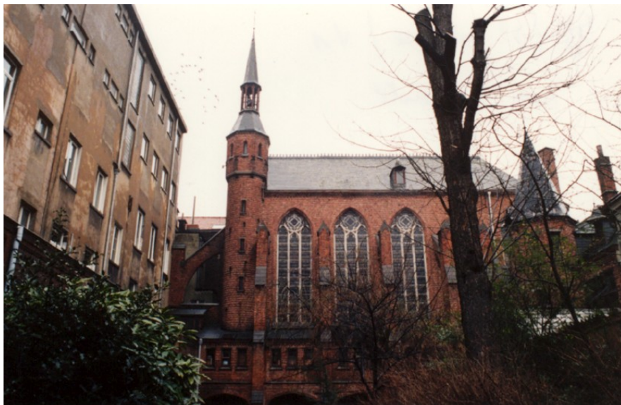
Liefdadigheidsstraat 41-45, Julianakapel en vml. klooster van de apostolinen van het Heilige Sacrament (foto 1993-1995).