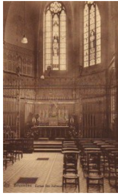
Julianakapel, afgestempeld op 1927 (Verzameling van Dexia Bank).